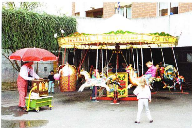
Freizeitvergnügen in einer der Institutionen

Gründungen bzw. Mitbegründungen durch die Gemeinnützige Gesellschaft Baselland und/ oder durch Persönlichkeiten aus deren Umfeld - nach Gründungsdatum -